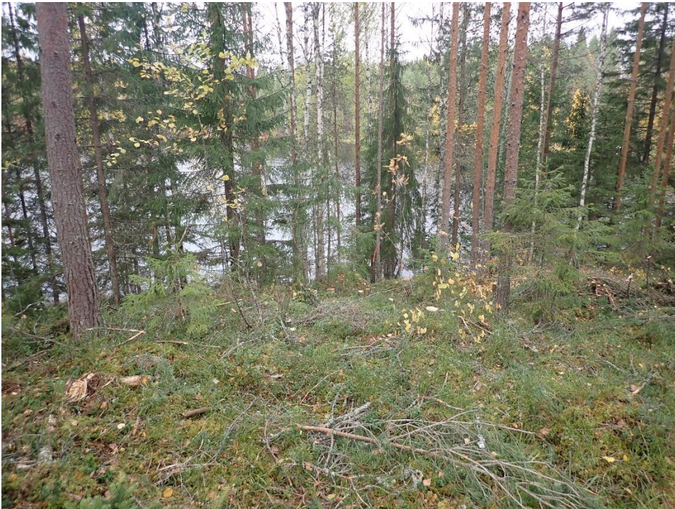
Läntinen rantakaava-alue Koveron etelärannalla. Kuvattu pohjoiseen.