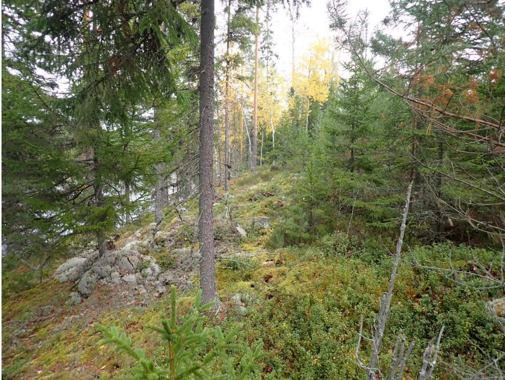
Itäinen rantakaava-alue rannan tuntumassa. Kuvattu itään.