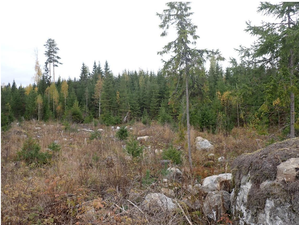
Itäinen rantakaava-alueen kuusikko kuvattuna sen eteläpuolelta. Kuvattu luoteeseen.