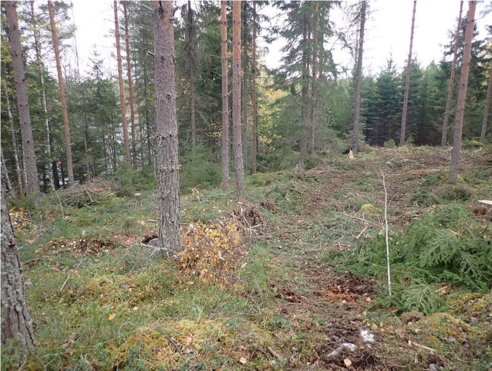
Läntinen rantakaava-alue rannalta kohoavan mäen päällä. Kuvattu itään.